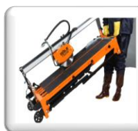
Roues de transport