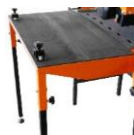
Table latérale (850x450mm) pour TS250