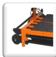
Transport Facile Avec ses 2 poignées