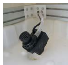
Pompe à eau de recharge avec prise