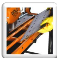
Table de coupe facile d'entretien