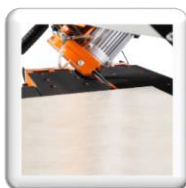
Coupe biseau 45°