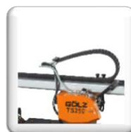
Avec sa chaîne de protection pour les câbles électriques et la durite d'eau