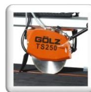
Diamètre du disque 250 mm, Profondeur de coupe 65 mm.