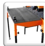
Table latérale (accessoire)